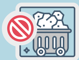
KOLENMIJNBOW EN TEERZANDWINNING

Meer over ons beleggingsbeleid, voorbeelddilemma's en ons MVB-beleid vindt u op de website, www.huisartsenpensioen.nl/beleggen .